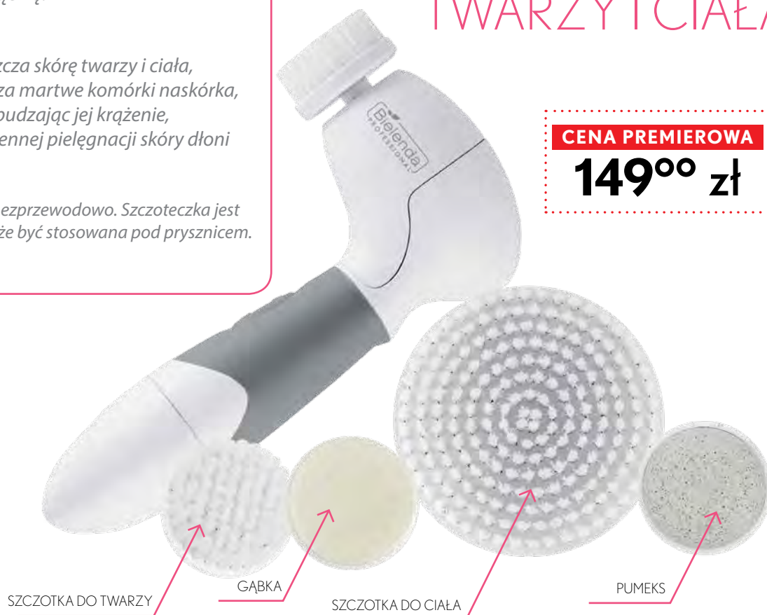
SZCZOTKA DO TWARZY