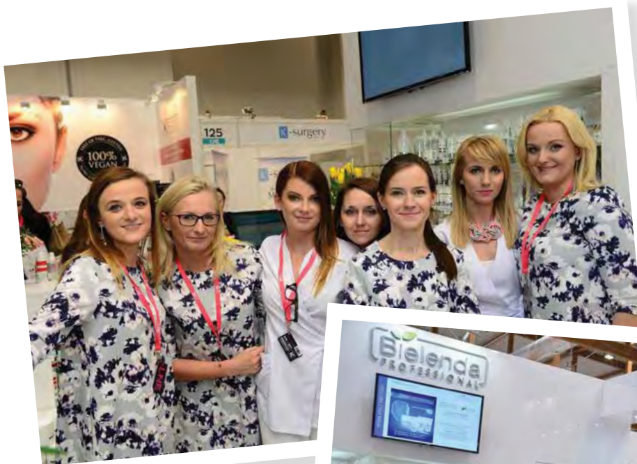
ZESPÓŁ BIELENDA PROFESSIONAL